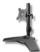
Fixation/ support VESA